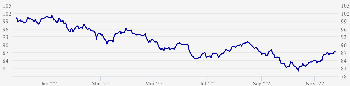
● Bærekraft 65 Valutasikret (P1)